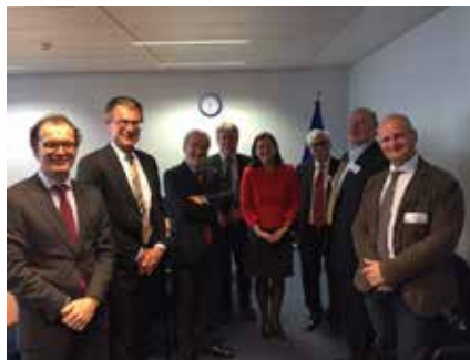
CCBE susitikimas su Komisija Europos prokuratūros klausimui aptarti.

Balandžio 25 d. Europos advokatūrų ir teisės draugijų taryba (CCBE) turėjo aukšto lygio susitikimą su Komisijos atstovais. Susitikimas buvo sušauktas tam, kad būtų galima aptarti tam tikrus pasiūlymo steigti Europos prokuratūrą aspektus. Buvo pabrėžtas poreikis nustatyti tinkamus procedūrinius saugiklius, ypač buvo nurodytas poreikis turėti veiksmingą teisinę pagalbos sistemą kaip esminis reikalavimas. Susitikimo metu taip pat buvo akcentuotas